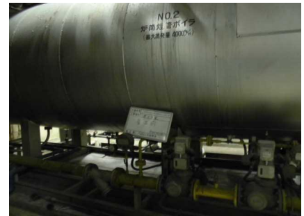
既設ボイラ解体・撤去