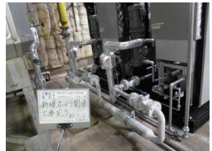
新規ボイラ設置完成